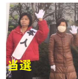
小林洋子新市長とともに