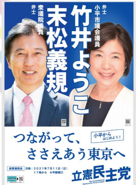
末松義規 衆院議員 との演説会ポスターが完成しました！