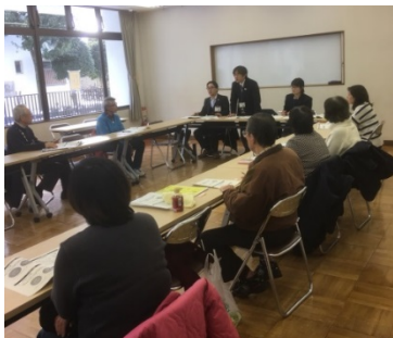
「ごみ有料化説明会」