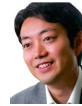
千葉市長 熊谷 俊人 (元会社の仲間)